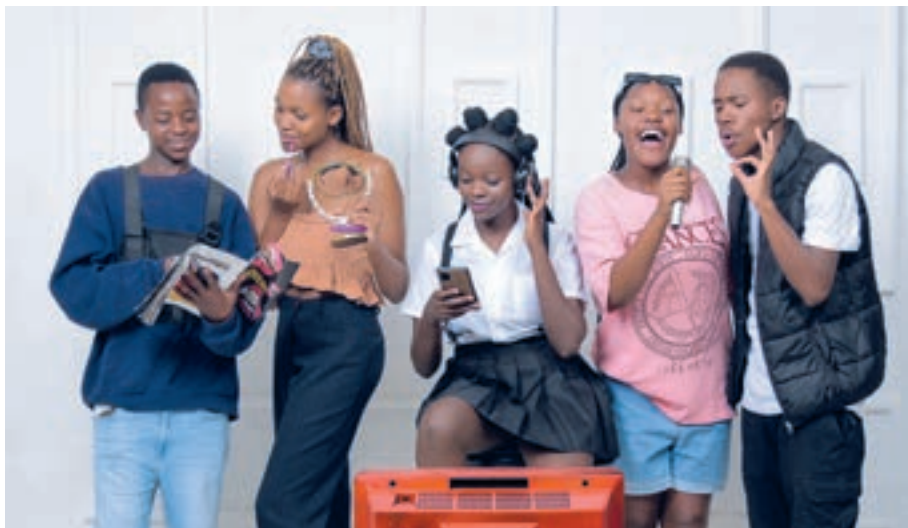
Die Gruppe IYASA kommt aus Simbabwe.