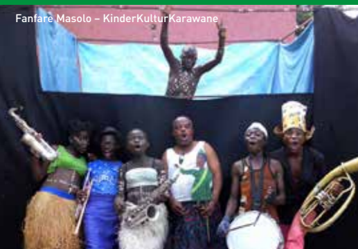
Fanfare Masolo – KinderKulturKarawane