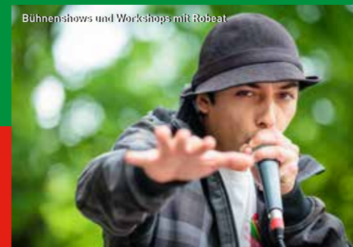
Bühnenshows und Workshops mit Robeat