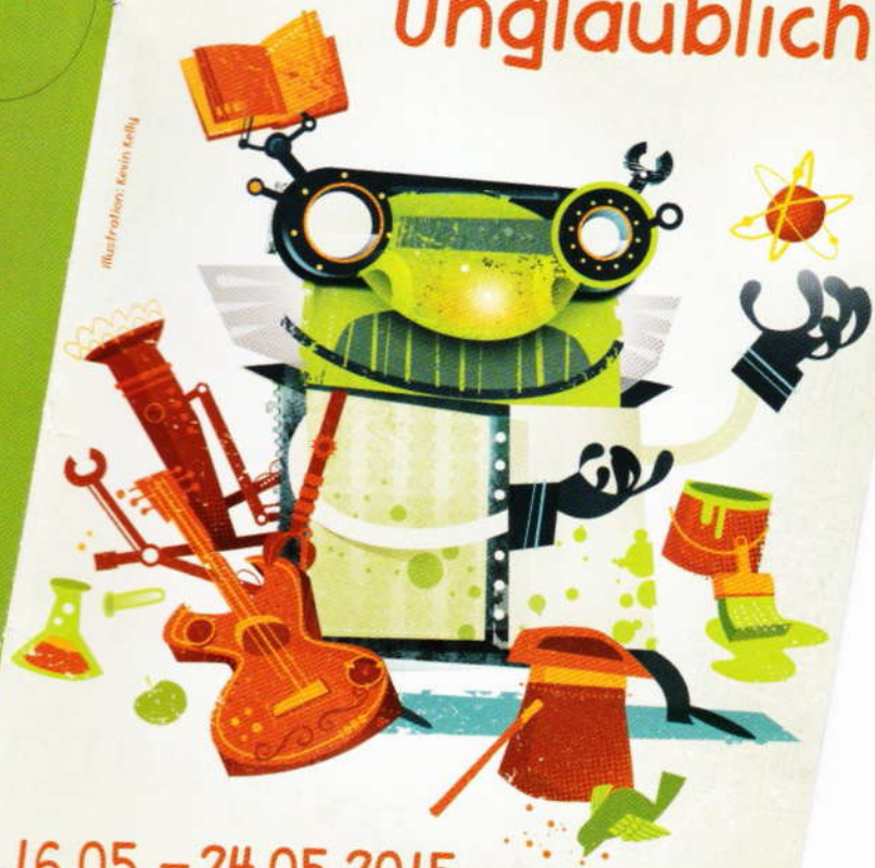
Illustration: Kevin Kelly